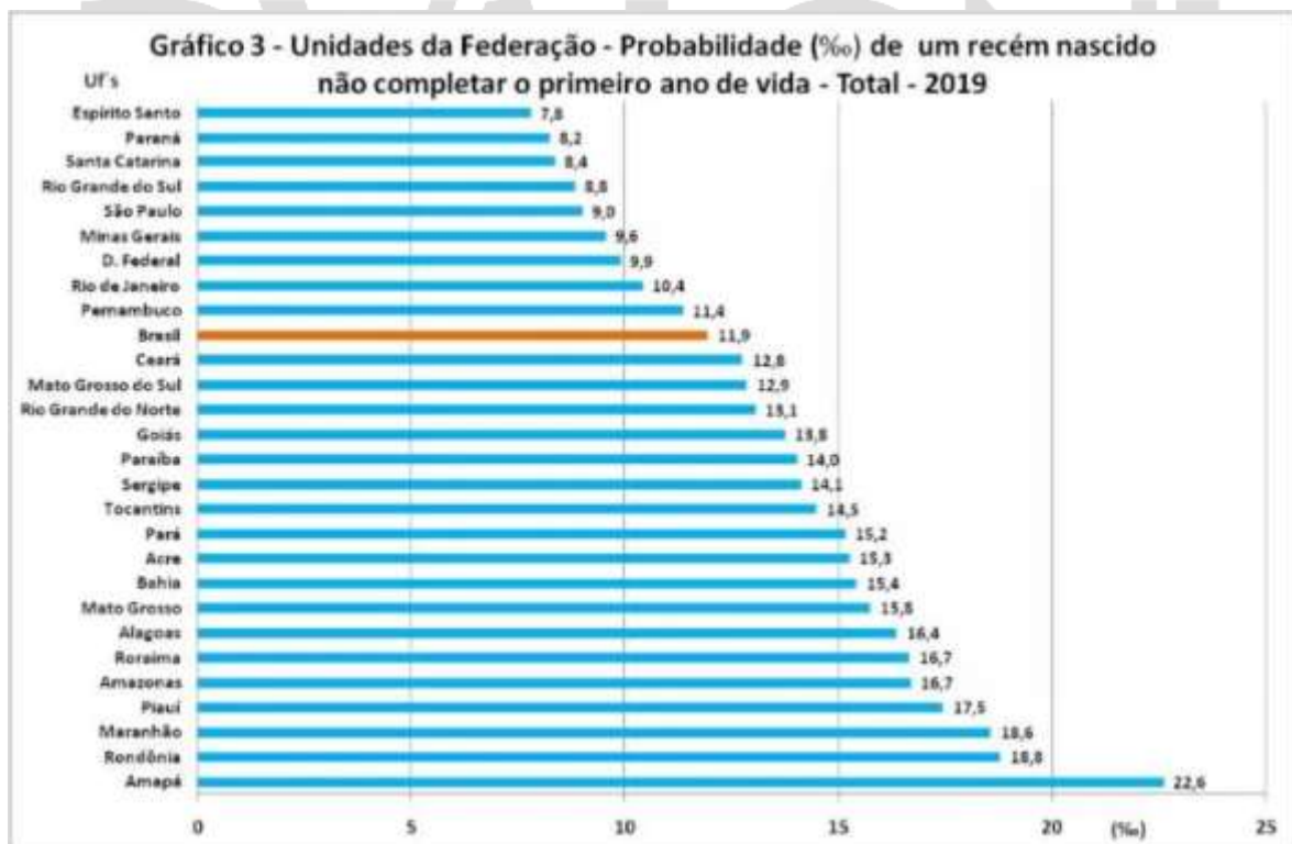
GRÁFICO DE MORTALIDADE INFANTIL POR FEDERAÇÃO

PROJEÇÃO da população do Brasil por sexo e idade para o período 2000-2060; Projeção da população das Unidades da Federação por sexo e idade 2000-2030. Rio de Janeiro: IBGE, 2013. Disponível em: < http://www.ibge.gov.br/home/estatistica/populacao/projecao_da_populacao/2013/default.shtm >. Acesso em: nov. 2015.